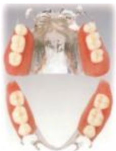
コバルトクロム床義歯