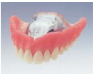
コバルトクロム床義歯