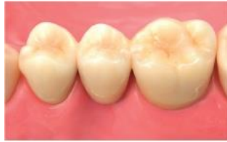
オールセラミッククラウンブリッジ