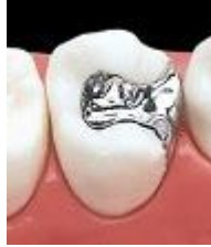
メタルインレー(銀歯)