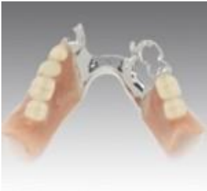
部分床義歯(プラスチック)