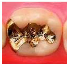
ゴールドインレー(20K)