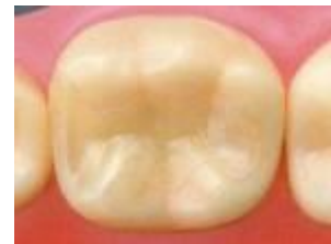
オールセラミックインレー

¥40000(前歯～小臼歯:中央部のみ)+税 ¥45000(前歯～小臼歯:隣接面含)+税 ¥45000(大臼歯:中央部のみ)+税 ¥50000(大臼歯:隣接面含)+税