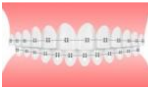
メタルブラケット(銀色)