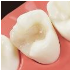
ハイブリッドセラミックインレー