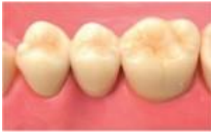
メタルボンドクラウンブリッジ